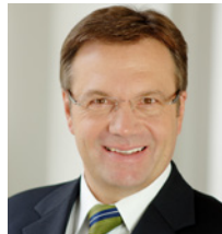
Günther Platter Landeshauptmann von Tirol

Ich wünsche allen Besucherinnen und Besuchern einen emotionsreichen Hörgenuss und viele klangvolle Stunden. Darüber hinaus danke ich dem Richard Wagner Verband Innsbruck/Bozen und allen Beteiligten herzlich für ihr Engagement bei den umfangreichen Vorbereitungen und der Ausrichtung der Veranstaltungen und wünsche einen reibungslosen und erfolgreichen Verlauf.